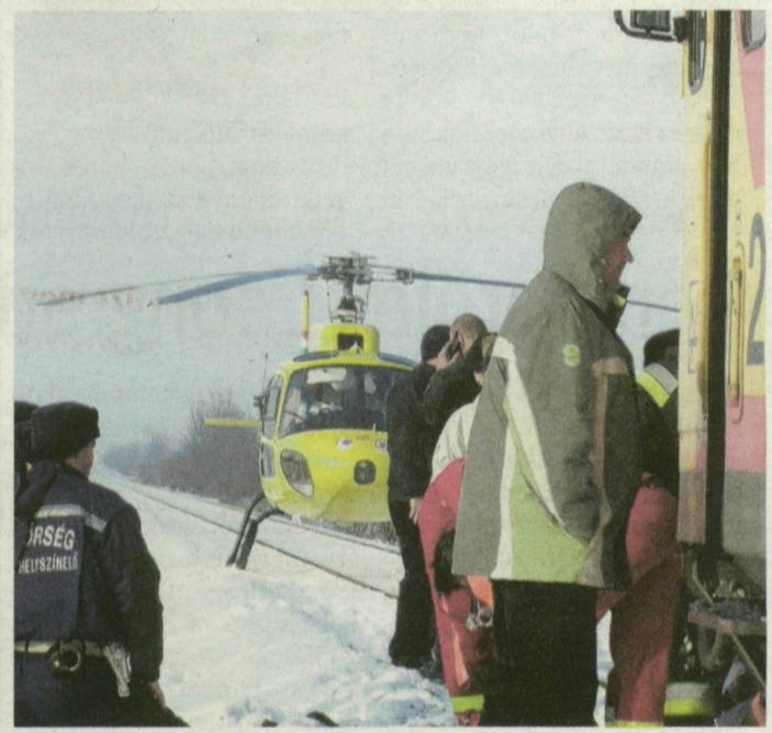
A napokban éppen a Bodzási úti fénysorompós átjárónál történt súlyos baleset.

A MÁV válasza szerint a félkarú sorompó kihelyezéséhez a Nemzeti Közlekedési Felügyelet hozzájárulása kell. Így a vásárhelyi polgármesteri hivatal a felügyelethez is intézett egy levelet, amelyben kéri, vizsgálják meg, biztonsági szempontból indokolt-e ezek kihelyezése. Vásárhelyen egyébként összesen 15 vasúti átjáró található. Ebből kettő teljes sorompós, 10 fénysorompós, míg 3 fény-, illetve félsorompós.