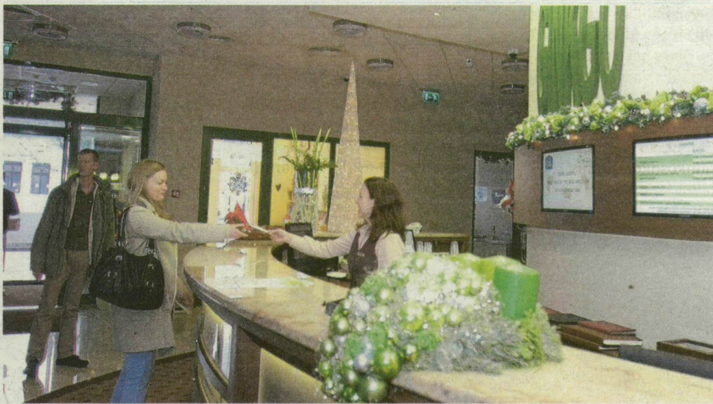
Négy hónapja nyitott. Karácsonykor szelíd volt az érdeklődés.

kos, ehhez társul közel 3500 vendégéjszaka, az átlagos tartózkodási idő pedig 2 és fél nap. Ezek a számok az őszi és téli időszakban elfogadhatók egy bevezetés alatt álló négycsillagos szállodánál. Kará-