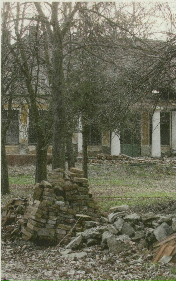
Sikertelenül keresnek befektetőt a felújításhoz.

Gazdaságé volt, tőlük vette meg a Cecília alapítvány az azal a céllal, hogy táborozás-