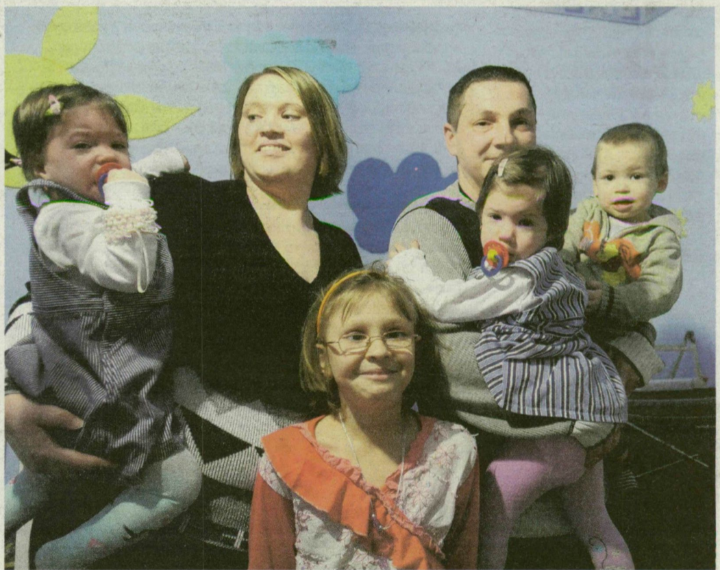
Nánásiék legmeghatározóbb élménye az volt, amikor az ikrek jární kezdtek.