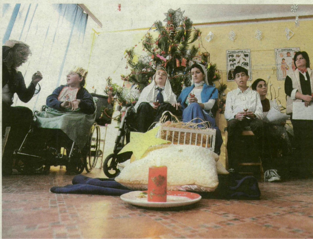
Szülőknek, támogatóknak énekeltek.

Lapunkban megírtuk: a Szívárvány Autizmus Egyesület