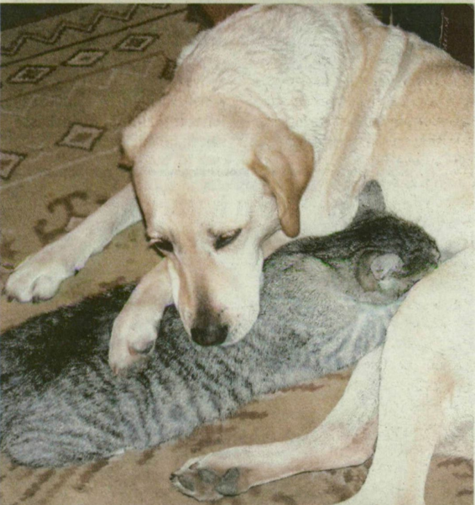
Olvasónk Cimbi névre hallgató labradorja fél éves szürke macskájukat védelmezi.

SMS-SZÁMUNK: 30/303-0921 KAPCSOLATOK@DELMAGYAR.HU