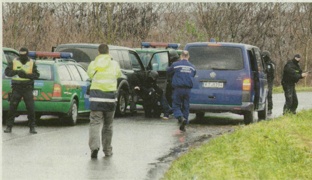
Kommandósok teperték földre a bankrablókat – gyakorlatról lévén szó, saját kollégáikat.

A határ túoldaláról terepjáróval érkező bankrablók, a kocsit szírnázva üldöző rendőrautók, útzár, kommandósok és bravúros elfogás – mindezt a kiszombori határnál láttuk tegnap.