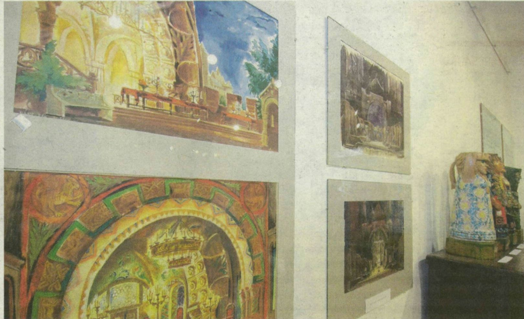
Varga Mátyás több mint 1500 színpadképéből jó néhány látható a kiállítóházban.

Száz éve született a magyar színháztörténet egyik legjelentősebb díszlettervezője, Szeged díszpolgára, a Kossuth-díjas Varga Mátyás, akinek két éve bezárt Bécsi körúti színháztörténeti kiállítóházát a felújítás után tegnap újra megnyitották.