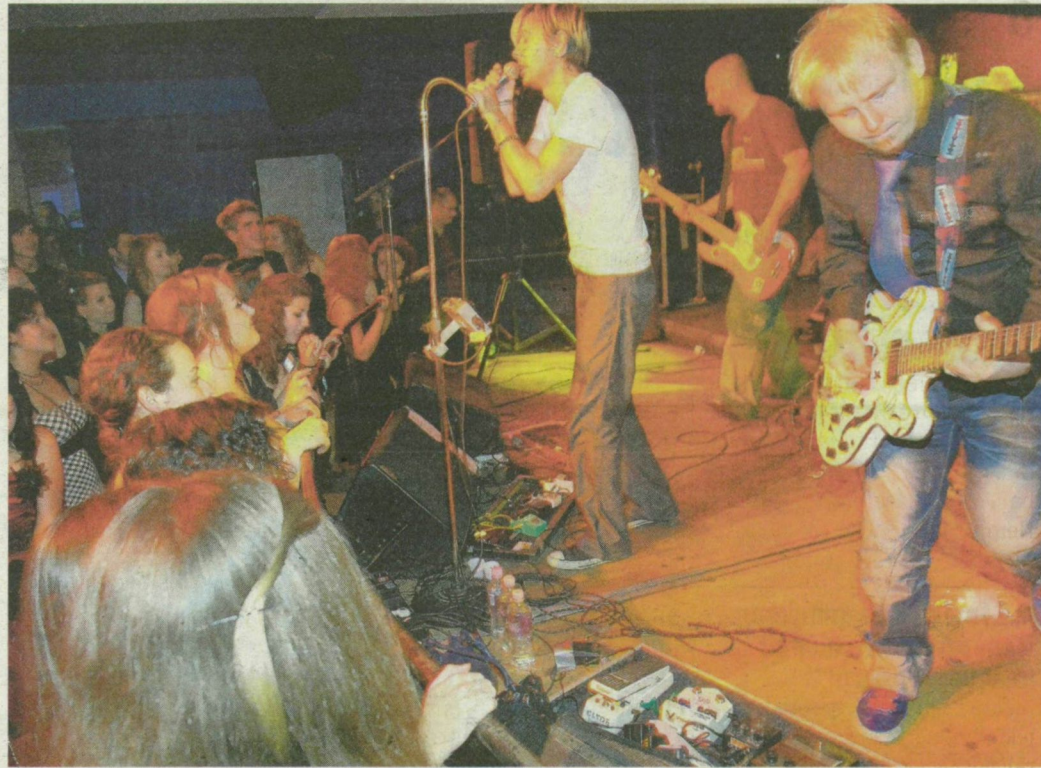
A 30Y koncertje felrázta a társaság nagy részét.

Éjfél után pár perccel az összes elsőéves egyetemista beözönlött a tereembe, hogy jobb kezét a szíve fölé helyezve elmondja a szokásos fogadalmat; mi pedig magukra hagytuk a tanulást helyett bulizásra felesküdt gólyákat.