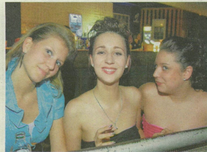
A gólyalányok idén is rendkívül szépek.

SZEGED. Bécsi keringővel és mambóval nyitották meg csütörtök este az idei egyetemi gólyabált a JATE-klubban – de a vendégek zöme csak később érkezett. A kisestélyibe, illetve öltönybe öltözött gólyák elein-