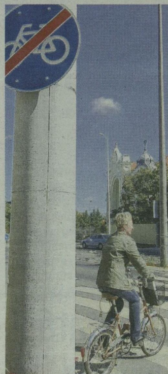
Tábla jelzi a vásárhelyi körforgalomban is: zebrán a biciklisek is gyalogolnia kell.