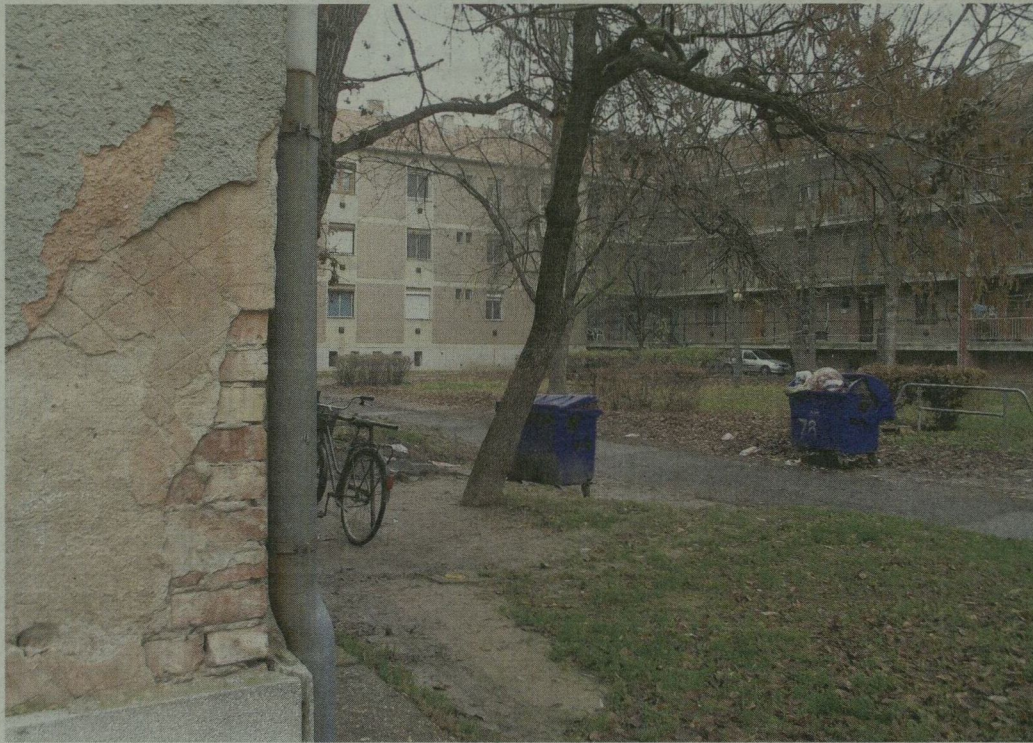
Ha zöld utat kap a program, 900 millióból rendbe teszik a Szabadság teret és környékét.