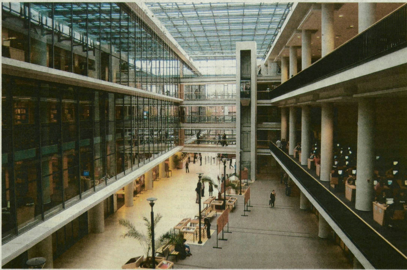
A szegedi TIK-et a jól sikerült épületek között tartja számon a szakma. Tényleg csak a munkaszervezésen múlik?

Kálmán szerint a többi probléma mind jogi természetű.