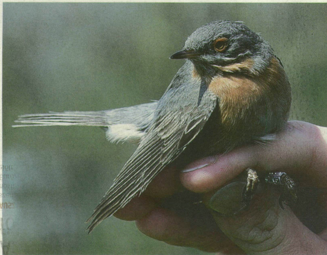
Bayszos posztát fogtak be Vásárhelyen. Elsőként a dalmát tengerparton figyelték meg a nálunk ritkán látott madarat.