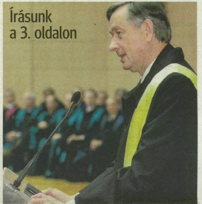
Danilo Türk szlovén elnök az SZTE díszdoktoraként mondott beszédet. Az emberi jogokért emelt szót.

MEGFENYEGETTÉK A VÍZIKÖZMŰ-TÁRSULÁS ELNÖKÉT