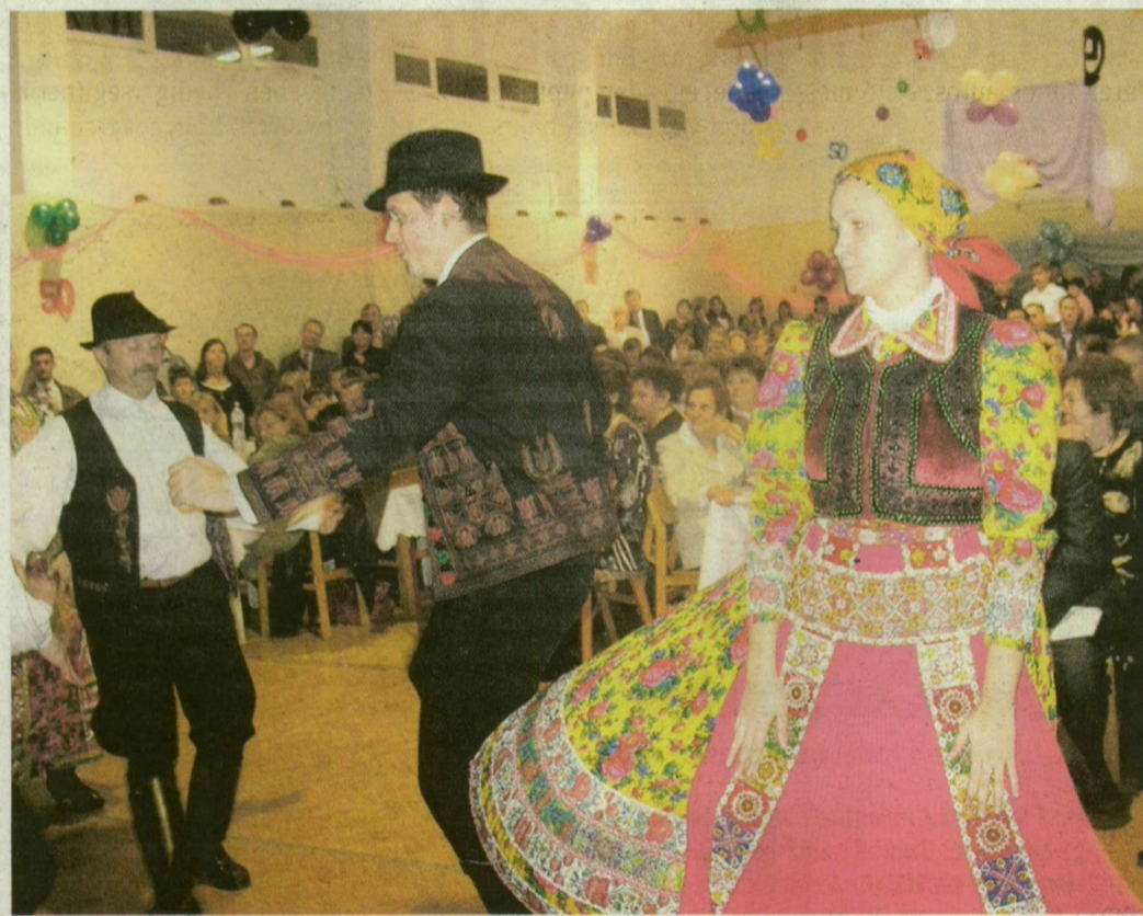
Az Alföld Néptáncgyűjtés műsorral köszöntötte a Gróf Széchenyi Általános Iskola egykori és mai tanárait és diákjait.