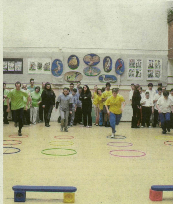
Ügyességi versenyeket rendeztek a sportnapon.

A közös bemelegítés után 10 intézmény 12 csapatának 120 versenyzője mérte össze erejét fociban és váltóversenyben: a legjobbak érmeiket kupákat is kaptak. A kezdeményezés olyannyira jól sikerült, hogy a jövőben folytatni szeretnék az ilyen találkozókat, mert a fogyatékkal élők számára különösen fontosak ezek a közös programok.