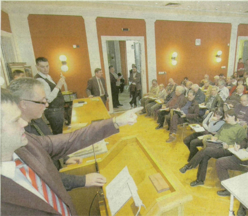
Licit a szegedi könyvverésen. Izgalmas pillanatok.