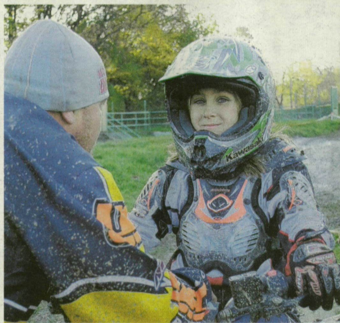
Kinga hallgat az apai tanácsokra. KOROM ANDRÁS

tunk neki megfelelő méretű kétkerekű járművet. Ezért vásároltunk neki egy 50 köbcentis, kétütemű, gye- rekméretű quadot. Kezdet-