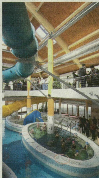
8 medence, 2 csúszda több szinten.

Tegnap avatták fel Mórhalmon a borházat is. Több mint 118 millió forintba – ebből 58 millió forint uniós támogatás – került a 250 négyzetméteres, akadálymentesített épület, amelyben két egymásba nyíló borkóstoló terem, kiállítóterem, bemutatóterem, konyha, iroda, fedett terasz, parkoló és játszótér is van.