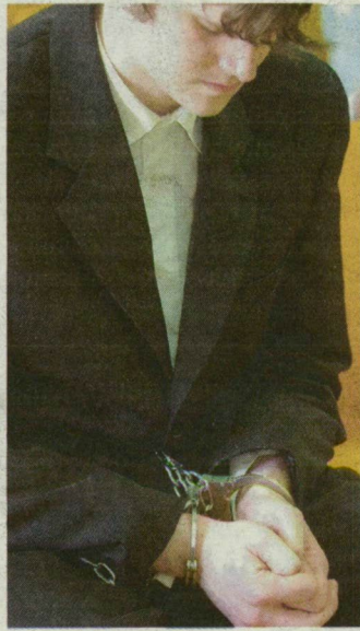
A barátnőjét megölő kalocsai férfi a bíróságon.

– A jogalkalmazó ezzel jelzi, hogy fellép a Magyarországon tapasztalható egyre agresszívebb hullám ellen, és a törvényes keretek között a súlyosabb büntetést választja – indokolta a 15 éves, határozott tartalmú szabadságvesztést életfogytig tartó fegyházbüntetésre változtató ítéletét augusztusban Hegedűs István táblabíró. Annak a kalocsai fiúnak az ügyében járt el, aki tavaly áprilisban bestiális módon végzett barátnőjével, majd megbecstelenítette a holttestét. A 23 éves férfi leg hamarabb 30 év múlva bocsátható feltételeken szabadlábra. – Egy évben nagyjából