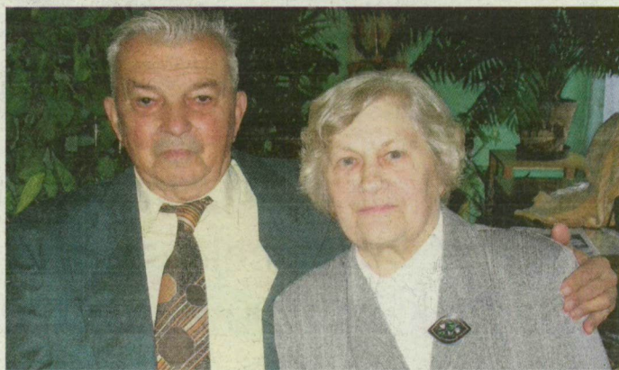
Pali bácsi és Margit néni mindig megtalálja a közös hangot.

– Olykor pörölünk meg egymással, de ki is beszéljük az ügyeket, mert ha egyből nem is értünk egyet, idővel megtaláljuk a közös hangot. Ez lehet a mi titkunk – mondta Margit néni és Pali bácsi , akiket fiuk és két unokájuk köszöntött fel házasságkötésük 60. évfordulóján.