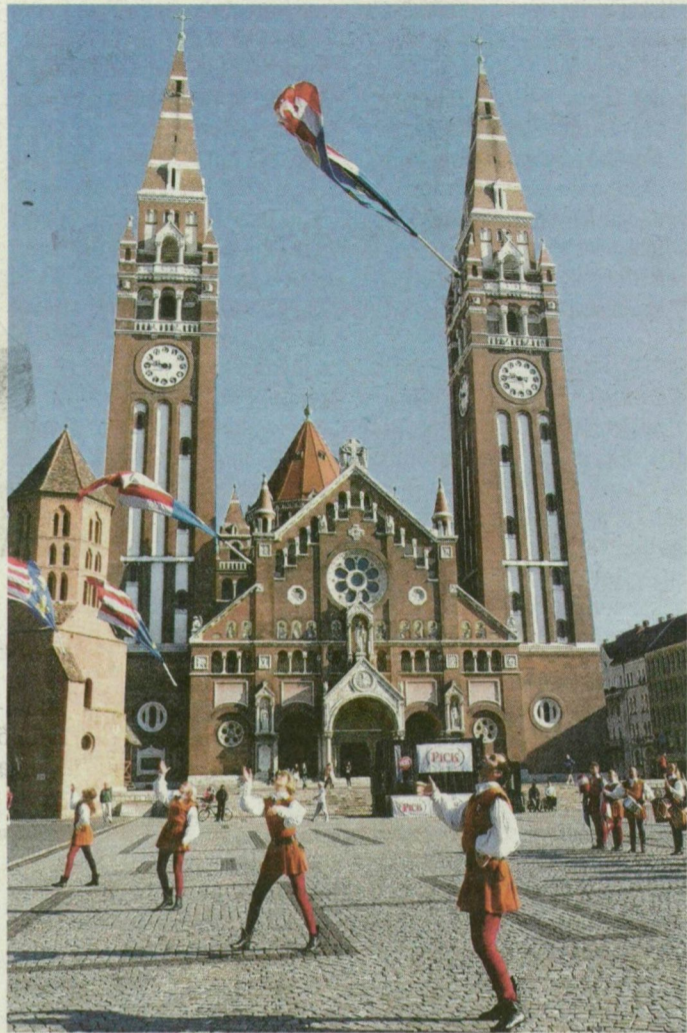
A két torony ma már szimbólummá vált, a tér pedig rendezvények otthona lett.