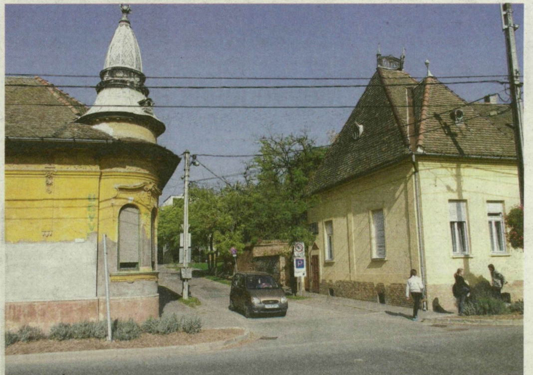
A vásárhelyi Szentkirályi utcának csak a sarki háza maradt meg.

A vásárhelyi belváros 1960-as évekbeli átrendezésének, a régi családi házak kisajátításának és lebontásának, majd bérházak építésének köszönhető, hogy itt található a város, a megye és talán az ország legrövidebb utcája, amelynek csak a sarkán maradt meg egy-egy ház, az 5. és a 10. szám. Az Oldalkosár és a Tóalj utcát összekötő Szentkirályi utca egykoron hosszán elnyúlt, ám mára csak a Tóalj utcai kereszteződésében maradt mutatónba belőle. Folytatás az 5. oldalon