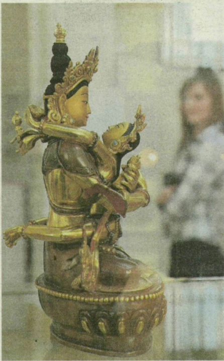
A múkincsek november 7-éig tekinthetők meg a múzeum kupolacsarnokában.

KERESZTMETSZET A MODERN MAGYAR SZOBRÁSZATRÓL A VÁRBAN