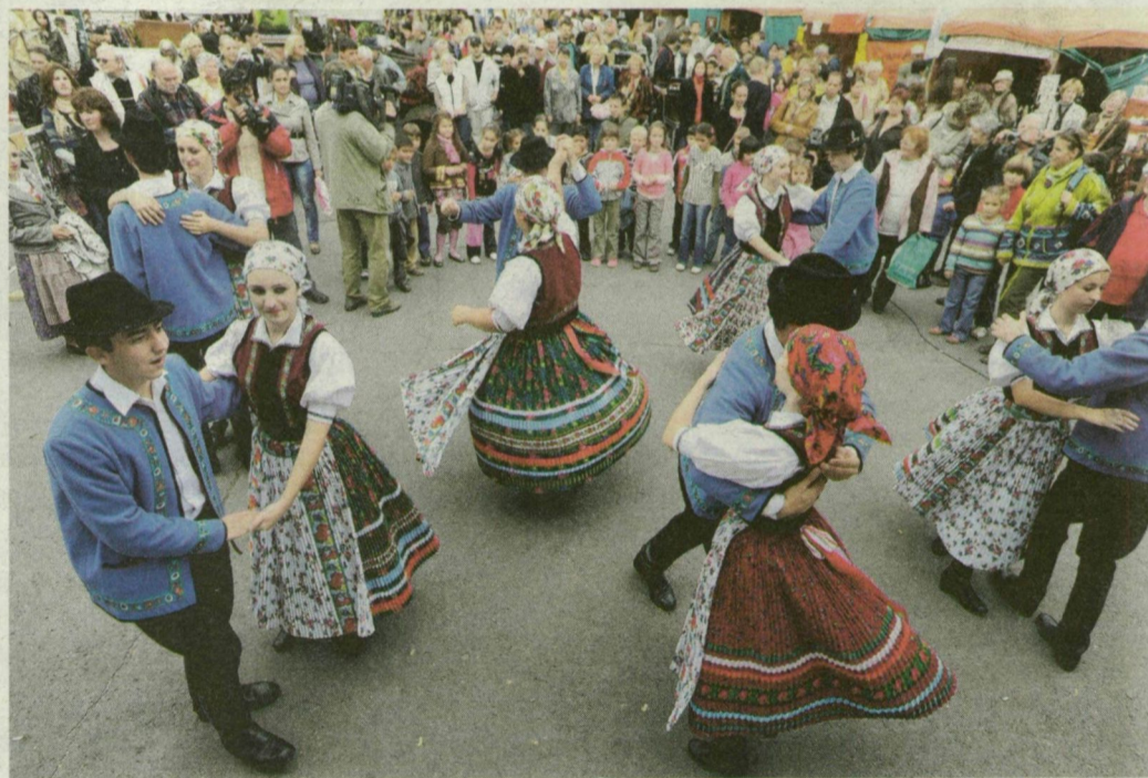
Táncosok nyitották meg a megyei Paprikasót Szegeden.