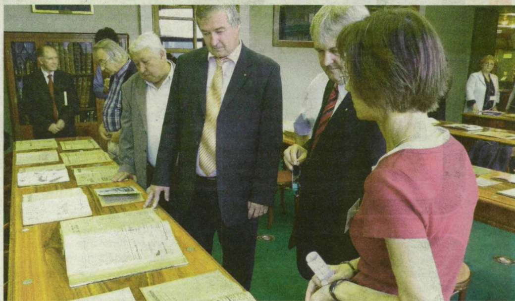
Kamarai vezetők a 120 éves kamara relikviáival ismerkednek a Somogyi-könyvtárban.

A Csongrád Megyei Kereskedelmi és Iparkamara ebben az évben ünnepli fennállásának 120. évfordulóját. A hungarikumfesztivállal párhuzamosan indult el az együttműködés a Somogyi-könyvtárral, amelynek keretében kamaratörténeti anyagok kutatásával és publikálásával segítik a kamarát abban, hogy a jeles évforduló alkalmából mind teljesebben ismerhesse meg múltját. A kutatás eddigi eredményét, korabeli dokumentumokat és sajtótermékeket a kamara vezetői is