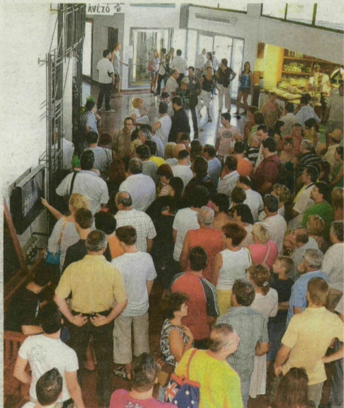
Egy hónap alatt 19 ezer 900 látogató érkezett, hogy megnézze az új kiállításokat.