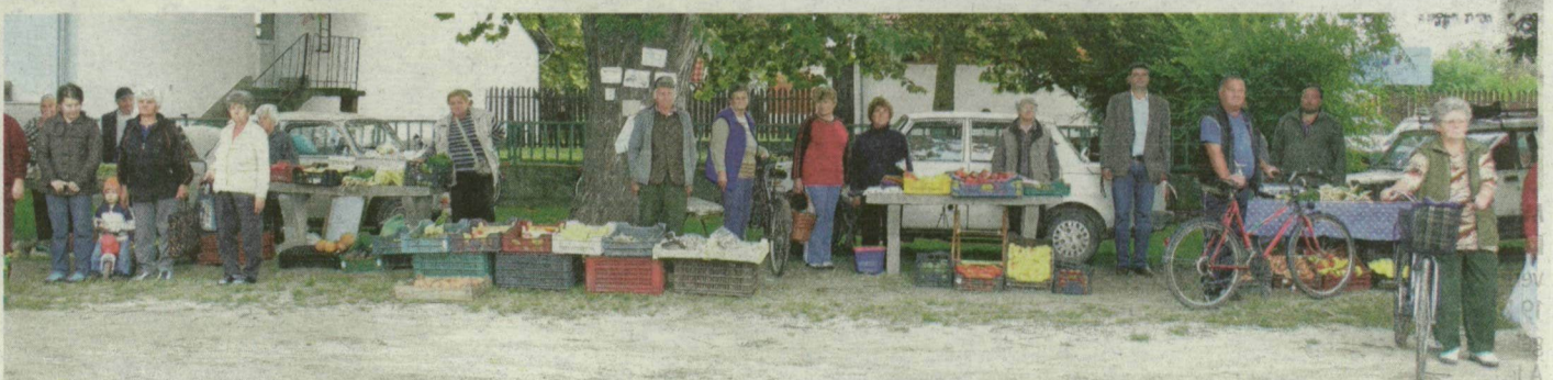
Eddig az út mentén kínálták portékáikat az árusok. Az új beruházás révén méltó körülmények közé kerülnek majd az árusok és a vevők is.

Az építkezés két héten belül elkezdődik, és időjárástól függetlenül már idén ősszel, de legkésőbb tavasszal átadják az épületet. Mindezen túl a pályázati pénzből a Béke utcában 14 két-karú kandeláberrel bővítik a közvilágítást, fákat, padokat telepítenek, valamint 60 új parkolóhelyet alakítanak ki a környéken. A megújult központ várhatóan nyár elejére készül el.