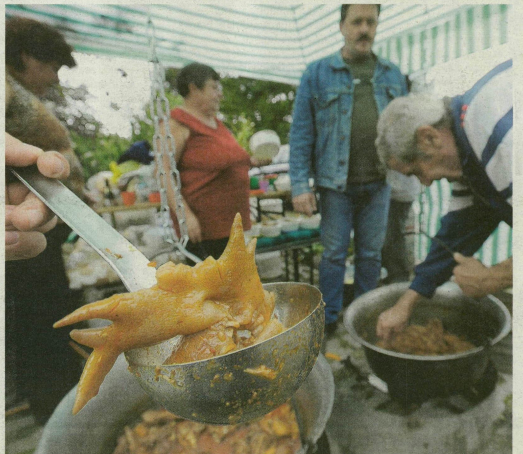
Nem úszták meg a kakasok: idén is a bográcsban végeztek.