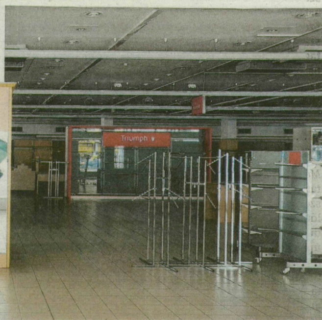
Csendélet. A máskor oly forgalmas áruházban se vásárló, se eladó, se áru.

Bezárt a szegedi Skála Áruház. A hivatalos verzió szerint technikai okok miatt nem nyitott ki az üzlet egy hete. Úgy tudjuk azonban, a 42 dolgozót elbocsátották, majd néhányat közülük visszavett az új üzemeltető.