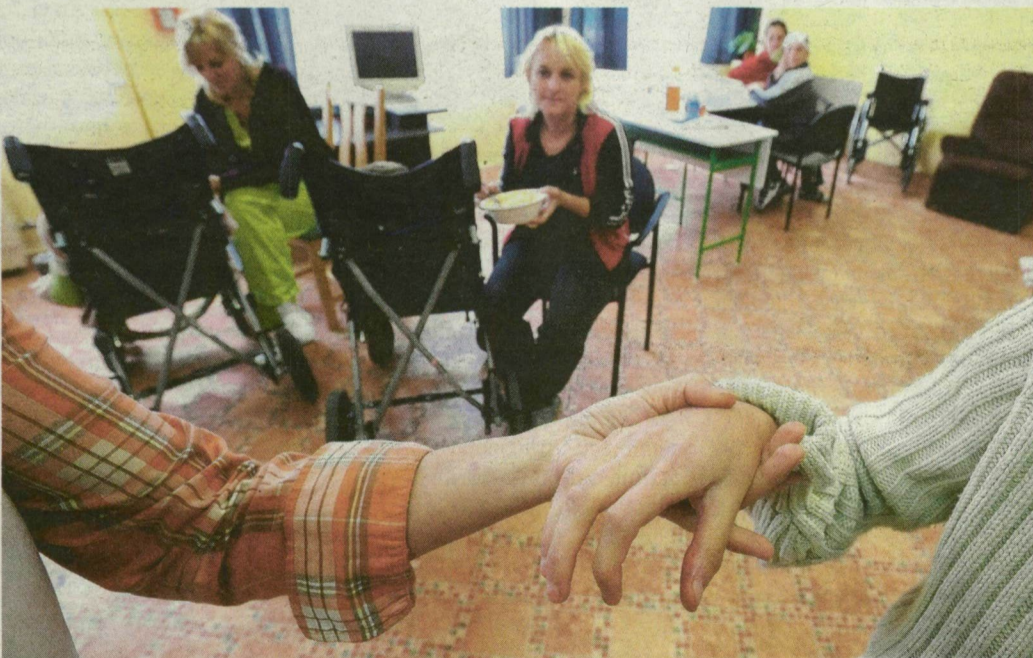
A GEMMA-ban minden súlyosan fogyatékos és halmozottan sérült gyerek kezét fogják.

Nem volt hiábavaló az a rengeteg munka, amelyet az utóbbi hónapokban végeztek az ügy felkarolói a szőregi szociális központ, fejlesztőiskola és fogyatékosok nappali intézményéért: szeptember elsején a GEMMA-ban is elindulhatott a tanév. Nyolc fiatalnak változott meg gyökereken az élete azzal, hogy az intézmény megnyitotta kapuit, hiszen ők, akiket súlyos, halmozott fogyatékosként miatt más intézmények nem tudnak felvállalni, értő és szerető közegben tölthetik napjaikat.