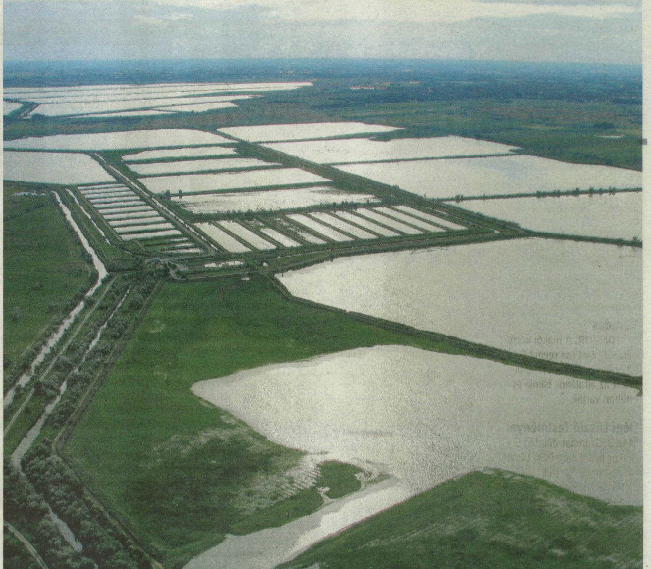
Gólyatöcs, üstökös géme, vörös géme és a Fehér-tó ezúttal – stílszerűen – madártávlattból.

nagy kócsagok. A százas csapatokba verődött nyári ludak, de látni hatyút, és a dankasirályok között a szerezcsensirályok még itt időző hírneműit. Megérkeztek a lengyel, ukrán, orosz területekről erre kóborló vándorok, és feltűntek az énekesek közül a nádi poszáták, fecskék. Egyszerre mindig legalább tízezer szállóvendéget találni a Fehér-tónál. De előfordul, hogy összeszalad 30–40 ezer ideiglenes lakó is; tavaly ősszel csak daruból 29 ezret számoltak meg néhány hetes pihenőjük közben. És még nem