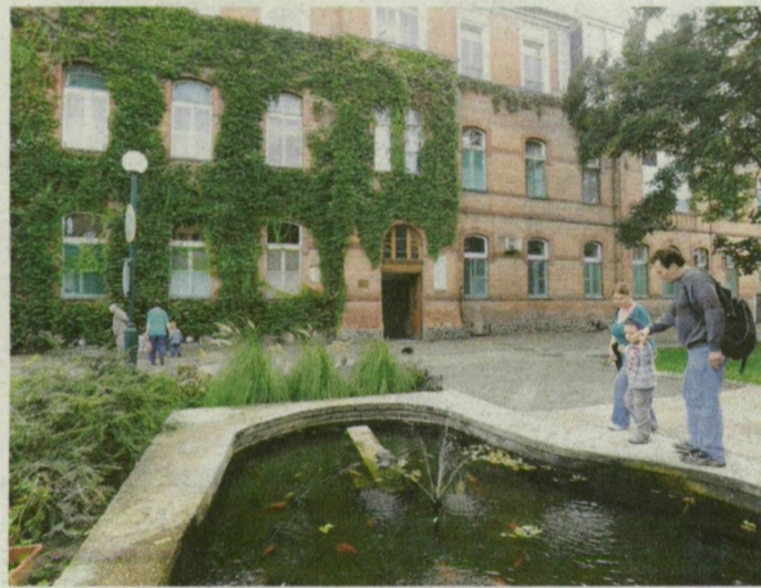
Az épületeket is átalakították.