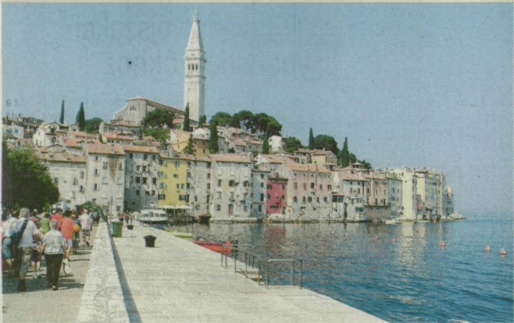
Az Adriai-tenger egyszerűen megunhatatlan, legalább tíz alkalommal kellene ott nyaralni, hogy észak-tól délig minden egyes részét bejárjuk. Olvasónk felvételét a Krk-szigeten készítette, ezzel a fotóval próbál egy kicsit még visszaidézni a nyarat a hűvös, őszi napokban.