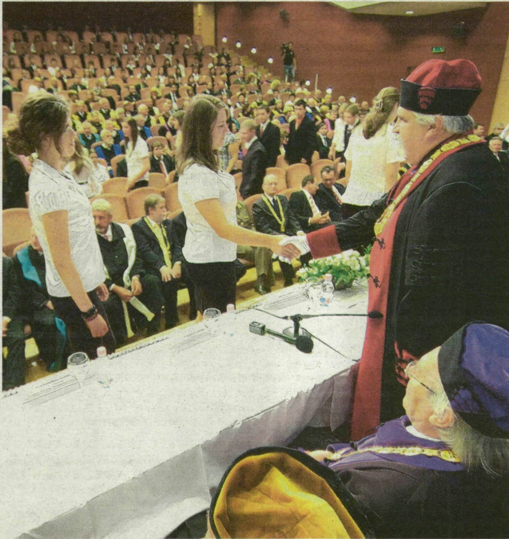
Szabó Gábor rektor kezét fogott az egyetem új polgáiraival, az első évfolyamos hallgatókkal.

Megújul az egyetem Dugonics téri központi épülete, épül a mérnöki kar laboregyüttese és az új klinikai tömb, Szegedre kerül a szuperlézer – mutatta be az ünneplő közönségnek a legjelentősebb beruházásokat is az