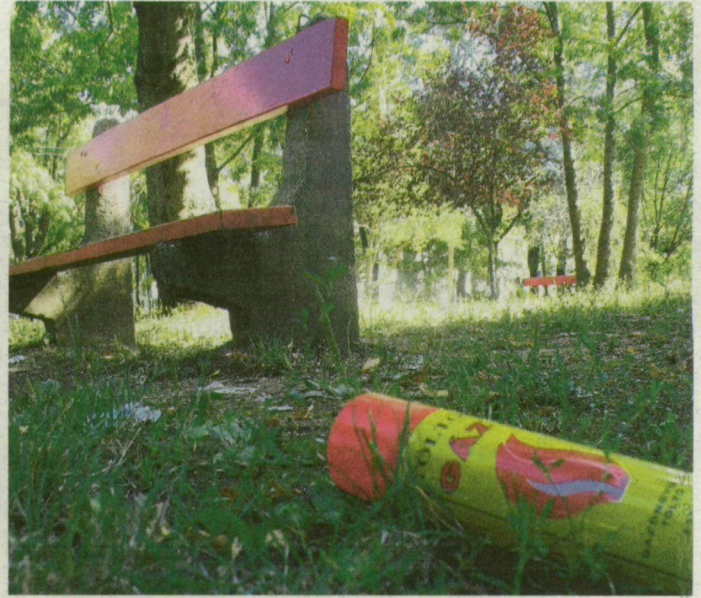
A gáztól meghalt fiút a piroskavárosi parkban találták meg.

Legutóbb két hete számoltunk be arról, hogy egy kiskunmajsai fiú kapott infarktust, miután töltőgázt szívott. A tinédzsert a szegedi belgyógyászati klinikára szállították. Nem volt szerencséje viszont annak a 13 éves szegedi fiúnak, akinek történetéről tavaly irtunk. Ő is hajtőgázt szívott, rosszul lett, kórházba került, de hat hónapnyi szenvedés után sem tudták megmenteni az életét.