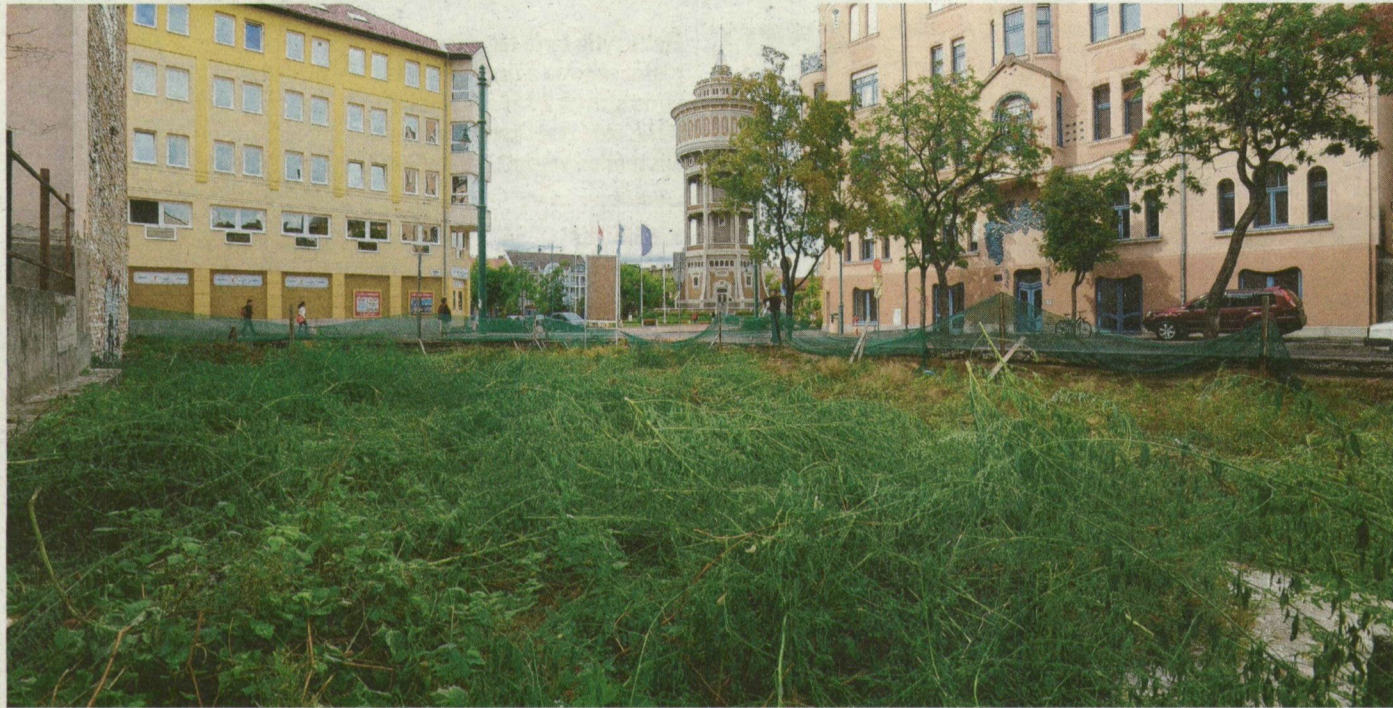
A Szent István tér és a Vidra utca sarkán lévő üres telken is szaporodik a gaz.