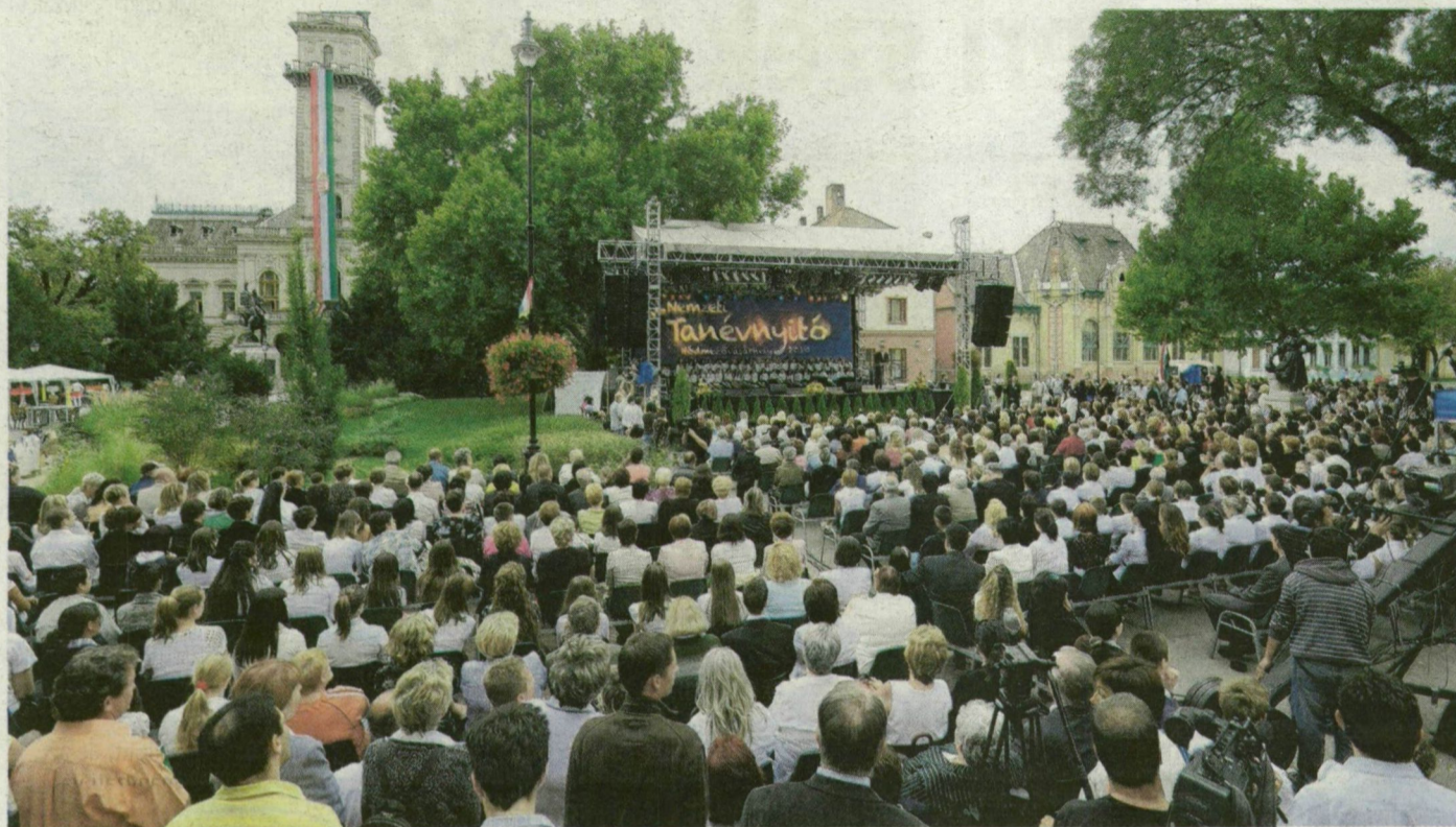
Tanárok, diákok, szülők, közéleti emberek. A Vásárhelyen tartott nemzeti tanévnyitóra megtelt a Kossuth tér.