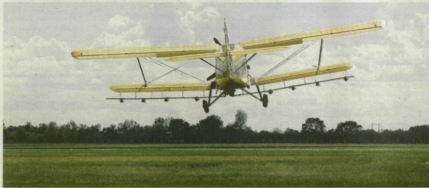
Két-három naponta fel kellett szállnia a repülőnek.