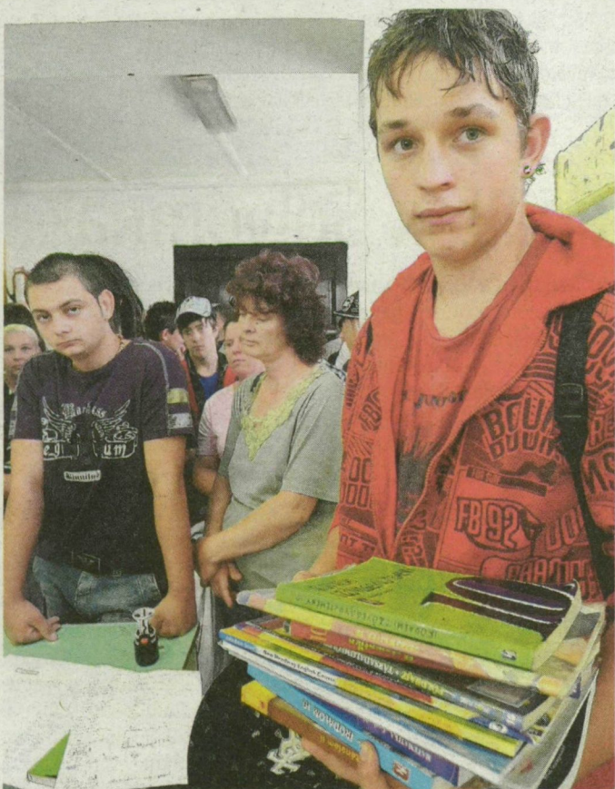
Tankönyvosztás a Szegedi Ipari, Szolgáltató Szakképző és Általános Iskola épületében. FOTÓ: SCHMIDT ANDREA

A Szegedi Ipari, Szolgáltató Szakképző és Általános Iskola három intézményében tanuló mintegy 1700 diák tankönyveinek körülbelül 85 százaléka érkezett eddig meg, de a hiányzó – főleg szakképzős – kiadványokat is a jövő héten viszi a szállító. Így a tanévkezdésre minden diáknak meglesz a teljes csomagja. Körülbelül 8500 kiadvány sorakozik a tornateremben – ezeket