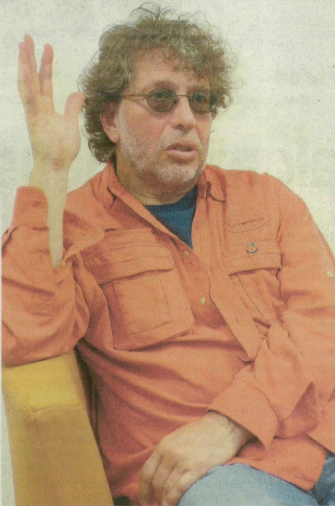
A Kossuth-díjas zeneszerző két zenekar vendégeként is színpadra lép a Partfűrdőn.