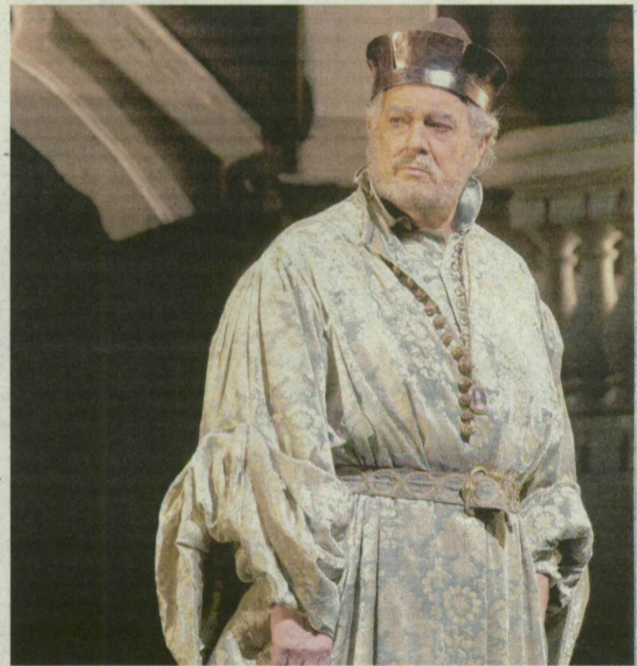
Plácido Domingo nemrégiben már egy másik bariton szerepben, Simon Boccanegraként is bemutatkozott.

A szeptember végén megjelenő új számot egy újabb 10 ezres címlistára küldik el, személyesen kiszállítva. Valamennyi sorszámozott példányhoz megjelentést, például DVD-t mellékelnek. A magazin csak előfizethető: éves díja 40 ezer forint.