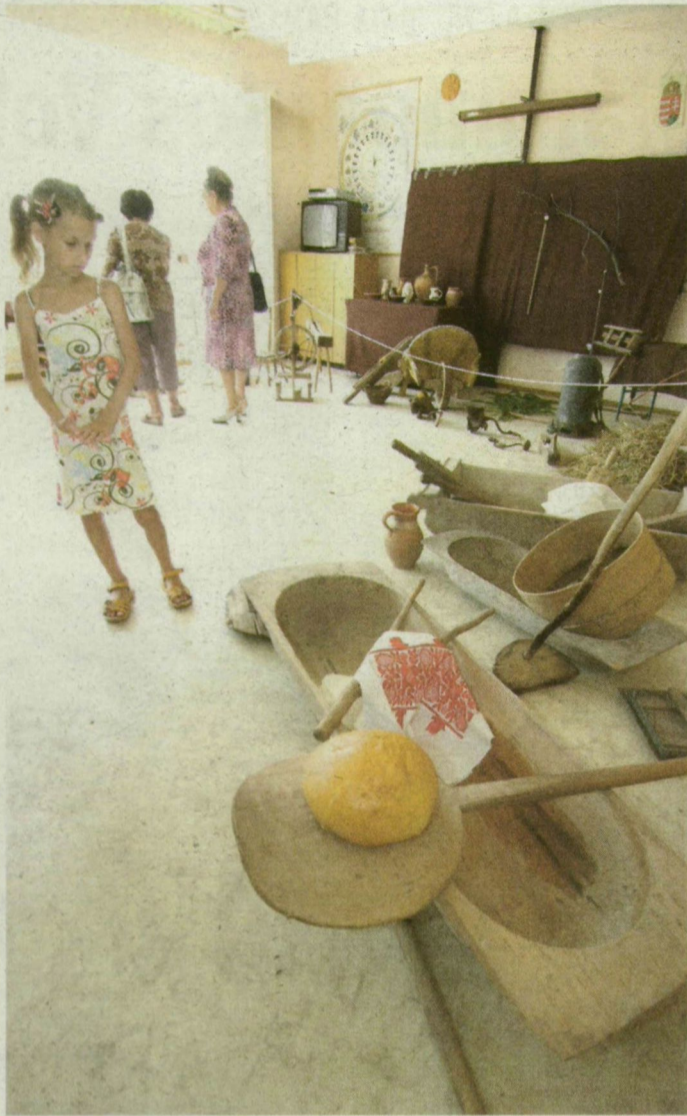
A múlt háztartási eszközeivel, régi tárgyakkal ismerkedhettek a falunapokon a zákány-székiek.

Manapság a „Száz szál piros rózsát küldöttem néked” feliratú falvédő aligha kap helyet a kerámialapos tűzhely és a hajlított üvegi páraelszívó mellett, a propán-bután gázpalack helyett sem hívják segítségül a fatüzelésű pörzsölőt, a petróle-