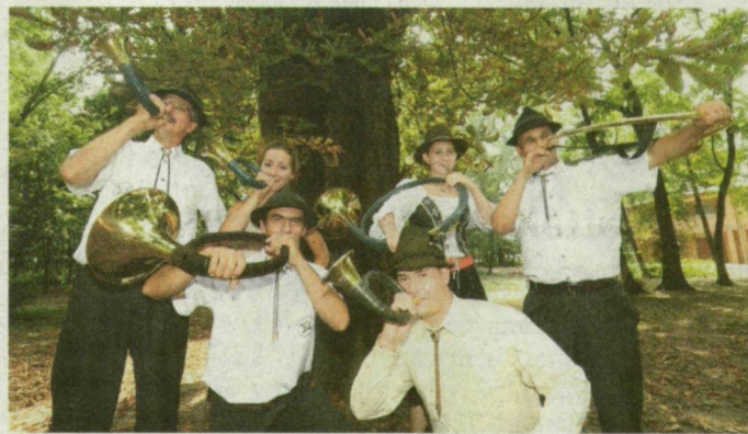
Vadászkürthatos a ligetben.

költet kavargattak, de volt, aki borzból készítette étjét. A Kállay sétány másik oldalán solymász-, íjász- és vadászkutya-bemutatót is tartottak – a hatalmas, loncos szőrű komondorok, a kis fekete pumik és a szimatoló vizslák fegyelmetlenül teljesítették gazdáik parancsát. A kutyusok mellett a Dél-tisza Vadász Társaság vadmadár-bemutatója volt a gyerekek kedvence.