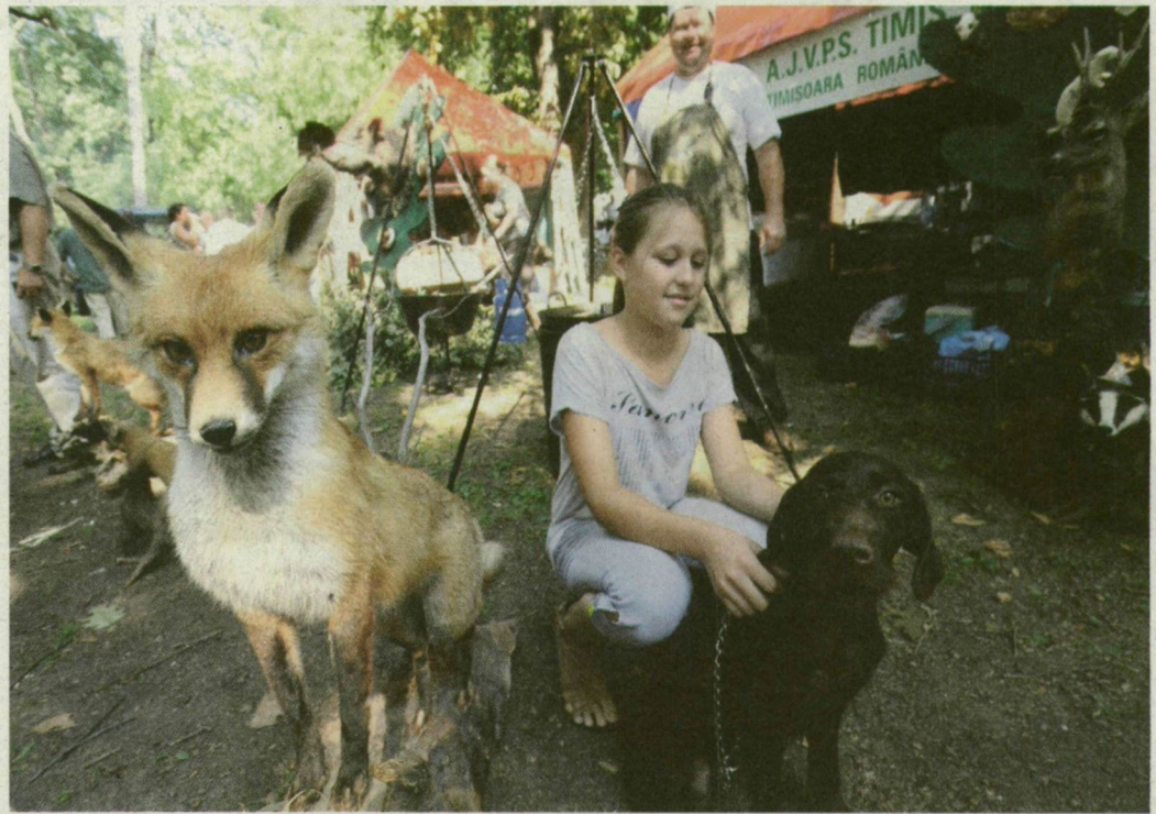
Kutya-róka-ember barátság a vadásznapon.