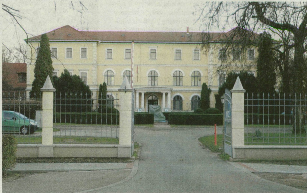
A deszki kórház kivételes helyzetben van: nincs kifizetetlen számlája.