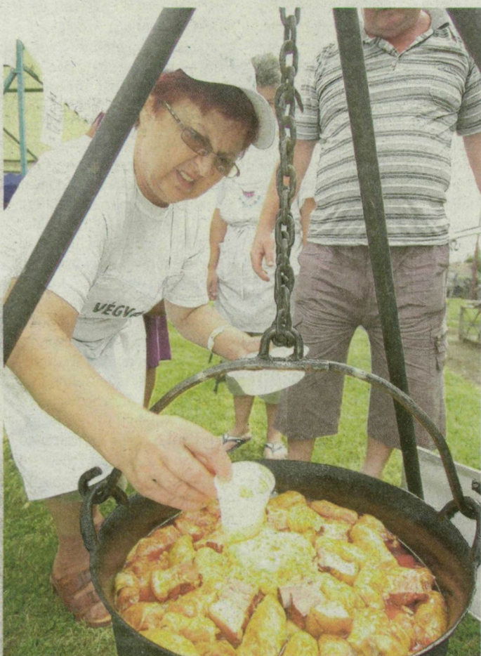
34-féle káposztavariáció készült szombaton Röszkén.