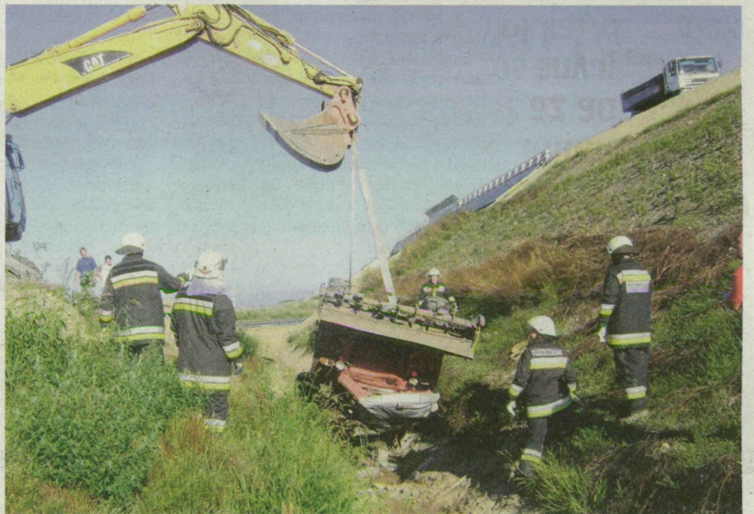
A szerencsétlenül járt férfit a tűzoltók vágták ki a roncsból, amit markolóval húztak ki az árokból.

19 MILLIÓ UTÁN FIZETTE A CSALÁD A DÍJAT – MIUTÁN BEDŐLT A FAL, 462 EZRET KAPOTT