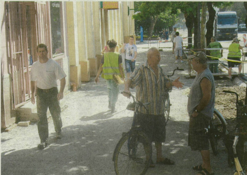
Az akadályokkal tűzdelt járda elriasztja a vásárlókat a Kossuth utca északi oldalán.

mondta lapunknak Tóth Gyuláné, aki sportruházati boltot működtet évtizedek óta a Kossuth utcán. Szerinte egyéni elbírálással kellene döntenie a kompenzációs igényekről, mert az általa bérelt városi helyiség 300 négyzetméter alapterületű, így amire számíthat, elenyésző ahhoz képest, hogy az elmúlt hetekben több olyan