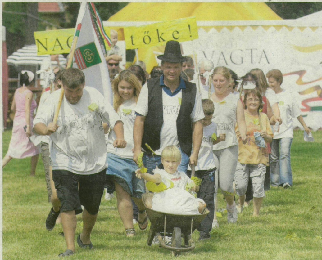
A nagytókeiek talicskával vágta neki az Ivádon rendezett versenynek.