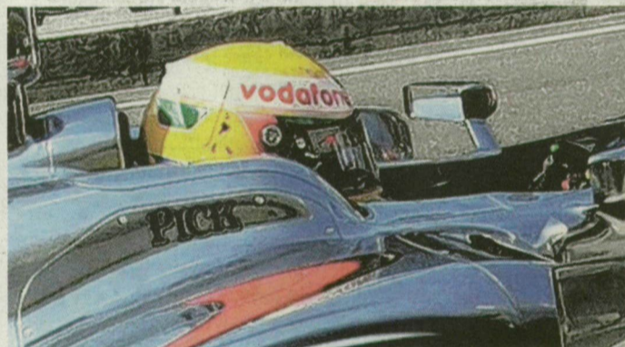
A Pick-logó felkerült a McLaren-Mercedes autóira is.

– Sikernek érzem, hogy az évek során többször próbálták leporolni a logót, de az alaphoz igazából nem nyúltak. Több-