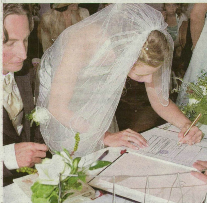
Az ifjú ara már az esküvői ceremónián elkezdheti gyakorolni új nevének leírását.

Nem tudni, hogy a pénz-e az oka vagy a hosszú sorban állás, mindenesetre az okmányirodában az utóbbi években az a tapasztalat, hogy egyre több nő szeretné leélni az életét férje mellett a lánykori nevén – legalább ebben megőrizze függetlenségét.