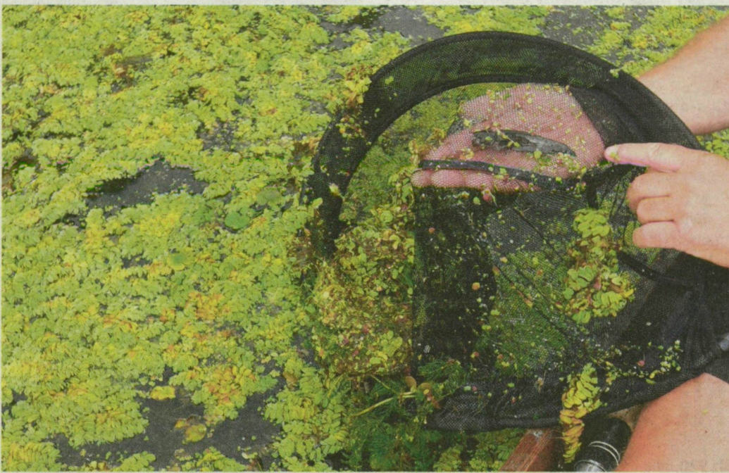
Szákkal lehet merni a védett növényt a vízből a szűnyogsziget oldalán. Leginkább a horgászok tartanak az elterjedésétől.

A telepeken élő rucaöröm spórával szaporodik, így ha minden egyes növényt kiemelnének vízből, az sem jelentene megoldást, a spórából ugyanis folyamatosan új és új példányok kelnek ki. Az előző években volt olyan, hogy futballpályányi