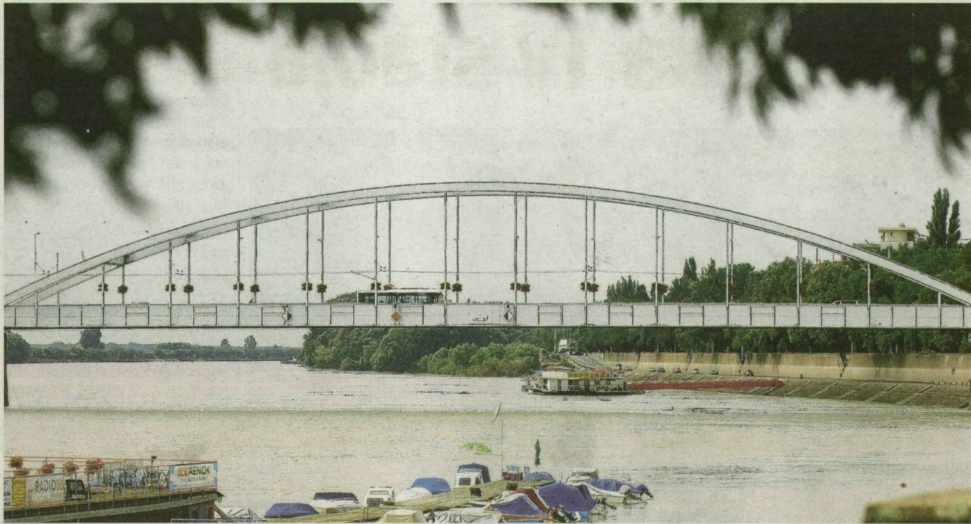
A 62 éves, 2001 óta Belvárosi hídnak nevezett átkelőre idén 15 millió forintot költött Szeged.