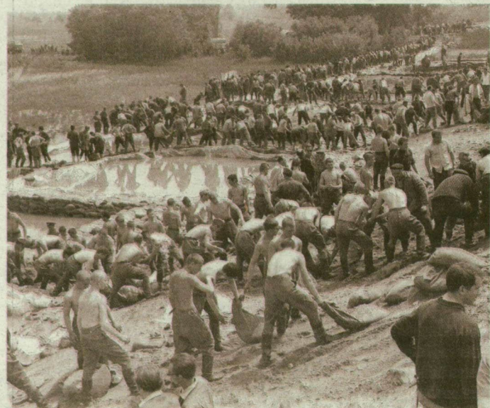
Óriásbuzgár Makónál, a Maros töltésénél.