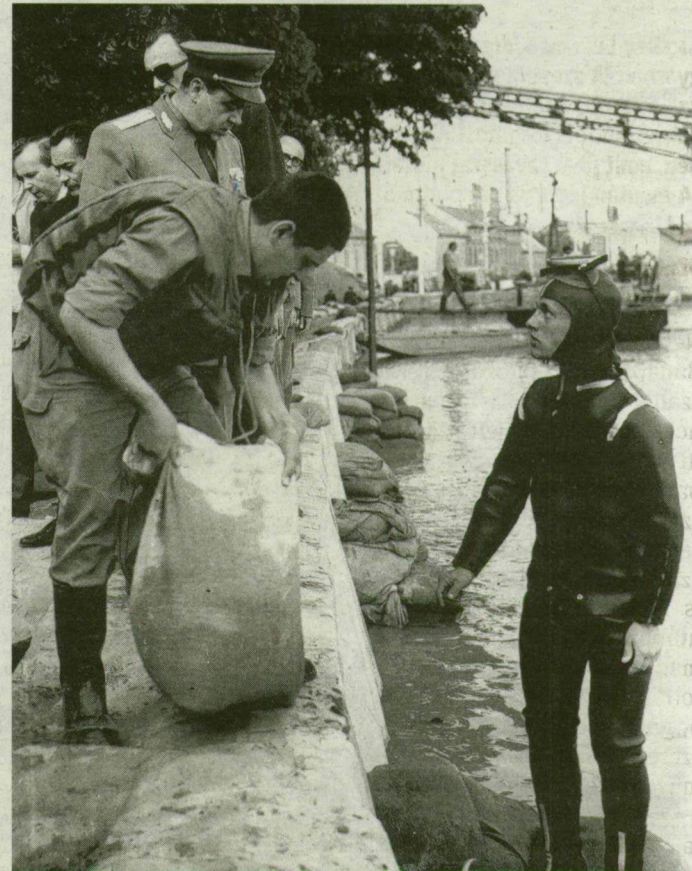
Czinege Lajos honvédelmi miniszter is megtekintette a szegedi helyzetet. A Stefánián figyeli a mentési munkát.