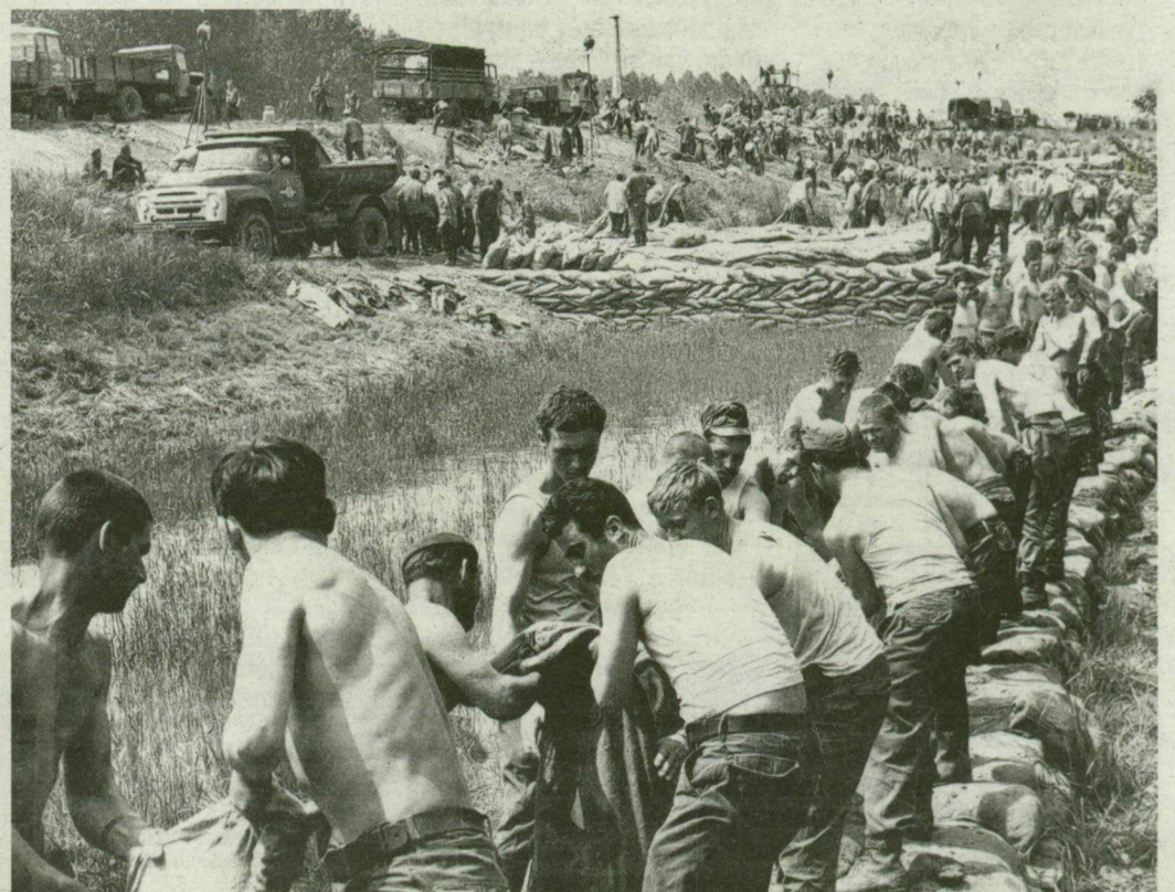
Emberfeletti küzdelmet folytattak 1970-ben Szeged megmentéséért.

KICSI A LEJTÉSE. A Tisza legkevésbé ismert tulajdonsága, hogy kicsi a lejtése: szabályozása előtt kilométerenként 2-2,5 centiméter, gátak közé szorítása után 4 centi az esése. Folytatás a 9. oldalon