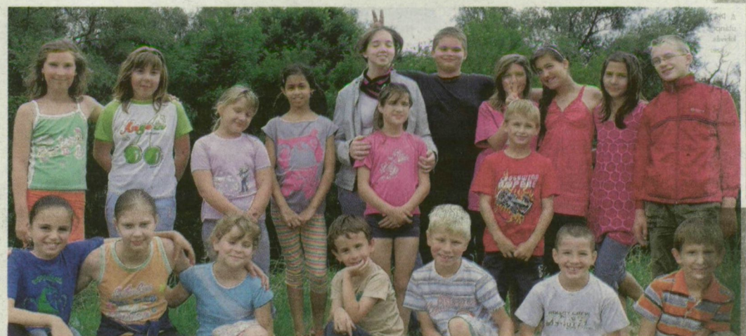
Tizennyolc pusztamérgesi iskolás vehetett részt a táborozáson.

ló pusztamérgesi gyerekek szerveznek napközis tábort a helyi plébánián. A programban foci, frizbi és sárkányere-