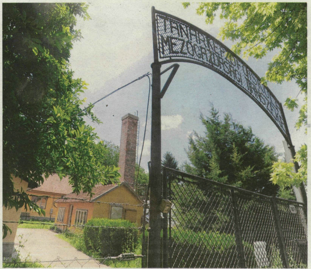
Gaz borítja az egyetem egykori mintagazdaságát.

egyetemisták. Előadó, bemutatóterem, háztartástechnikai és agrotechnikai laboratórium, valamint kertészeti és agrotechnikai tankert működött a gazdasági mintatelepen, ahol 150–200-féle növény élt. Volt üvegház, paradicsomot és paprikát is termesztettek a fólia alatt, a